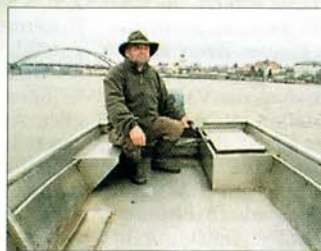
Für seinen Fischreichtum ist der Fluss bekannt. Einer der letzten Berufsfischer bei der Arbeit.