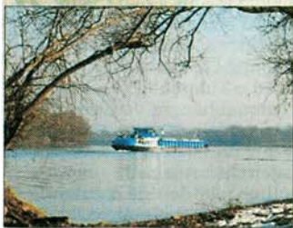
Ein Schiff fährt auf der Donau. Für solche Frachter soll der Fluss ausgebaut werden.