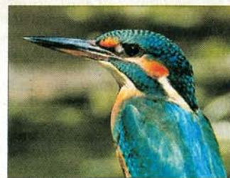
Eisvogel gibt es nur noch selten in Europa, an der Donau werden sie noch gesichtet.