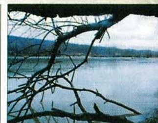
Die Mündung der Isar in die Donau ist eines der wertvollsten Naturschutzgebiete überhaupt.